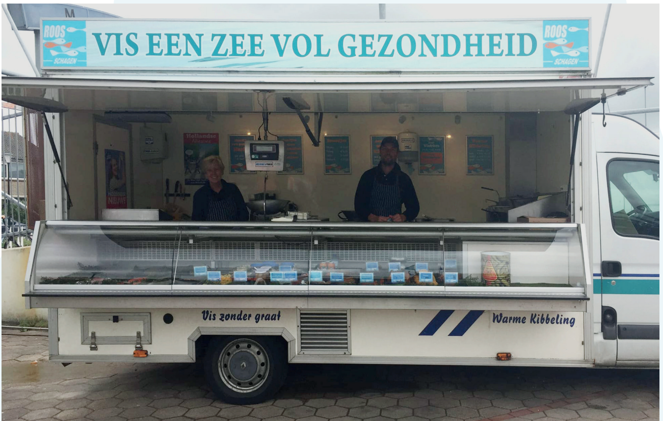
De ondernemers van Schagen vergeten de hospice niet, zoals Vishandel Roos