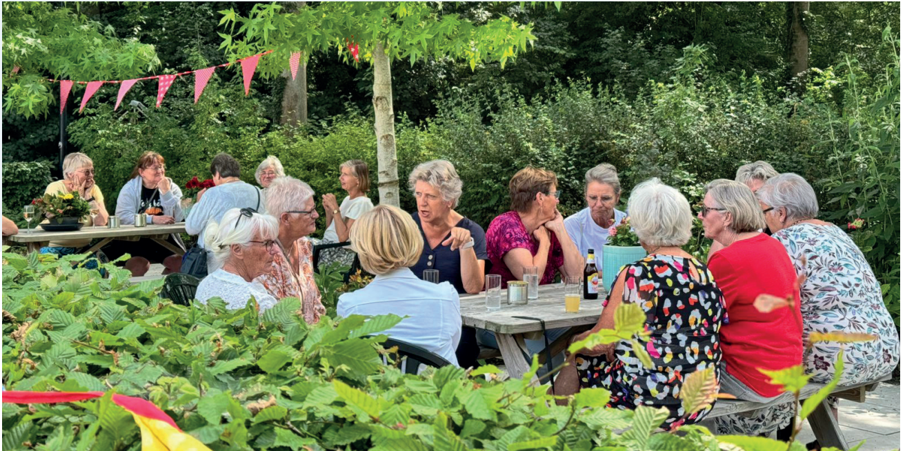
De jaarlijkse barbecue was weer met mooi weer!