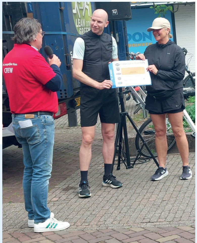
Twee teams liepen de business Run tijdens de Langedijker Run