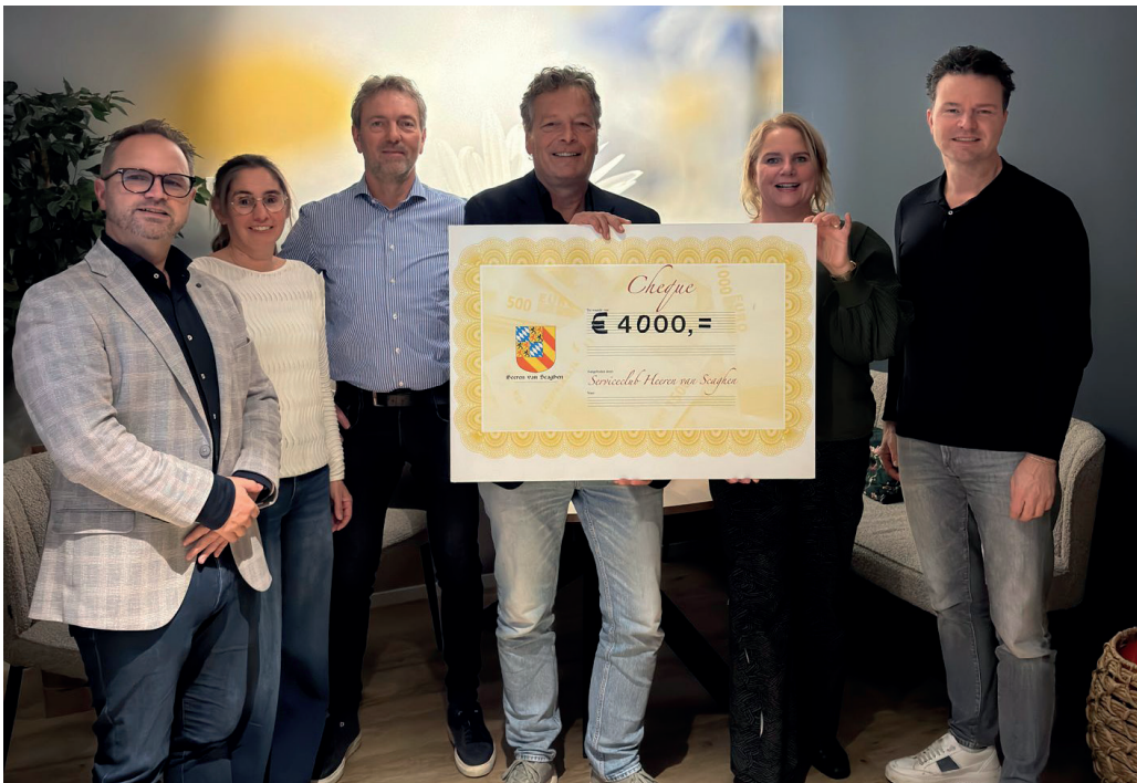
Heeren van Schagen opbrengst amuseronde