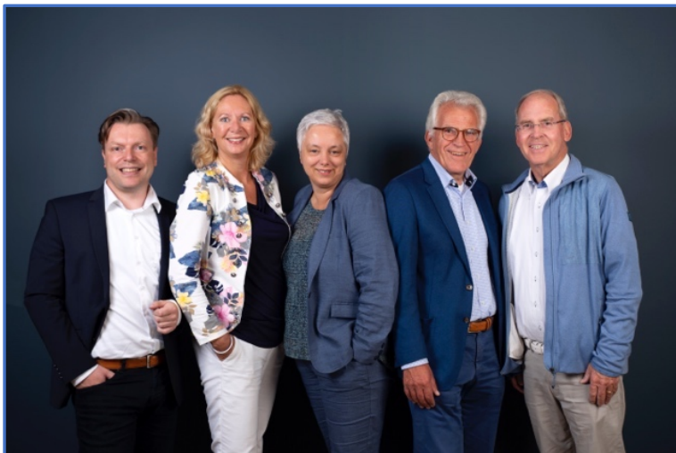
Het bestuur van Hospice Schagen

hebben kunnen betekenen voor onze gasten, familie, medewerkers en Vrienden van Hospice Schagen. Of het nu gaat om palliatieve zorg en ondersteuning, (sponsor)projecten, of voorlichting en educatie.